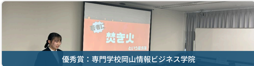
優秀賞：専門学校岡山情報ビジネス学院